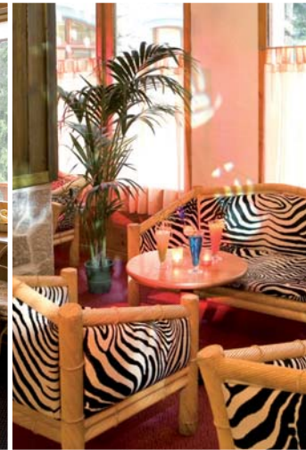
Photos avant nouvelle décoration